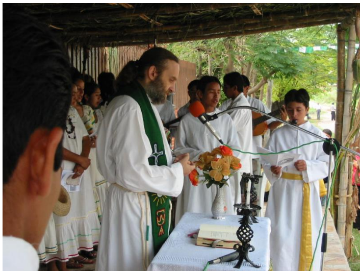
Msza św. na główny placu w San Ramón