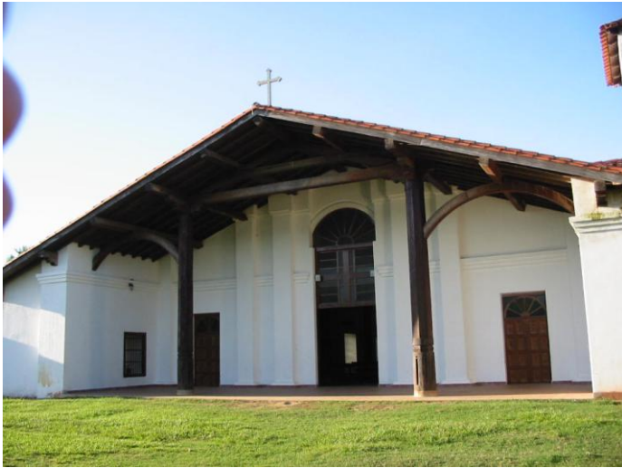
Kościół w Yaguarí