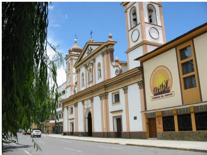
Kościół i klasztor „El Hospicio” Cochabamba