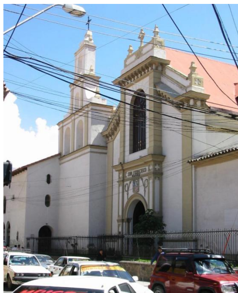
Kościół i klasztor p.w. św. Franciszka