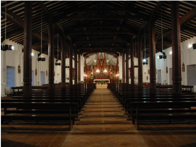
Wnętrze kościoła w Yaguarí