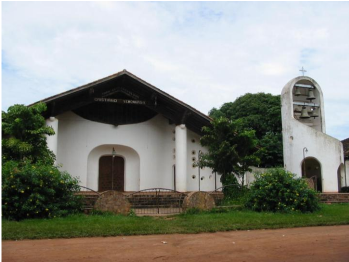
Kościół w Urubichá