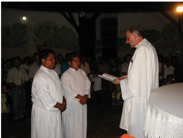
Pierwsi szafarze nadzwyczajni Komunii św. w San Pablo