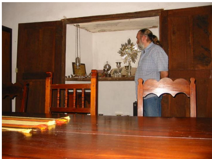
Srebrne naczynia liturgiczne z połowy XIX w. wykonane w warsztatach złotniczych na Guarayos.