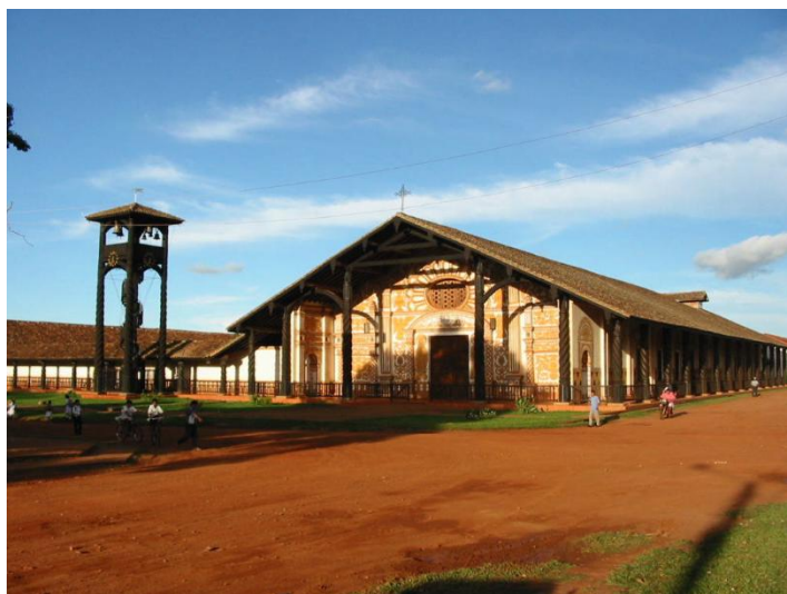
Katedra w Concepción