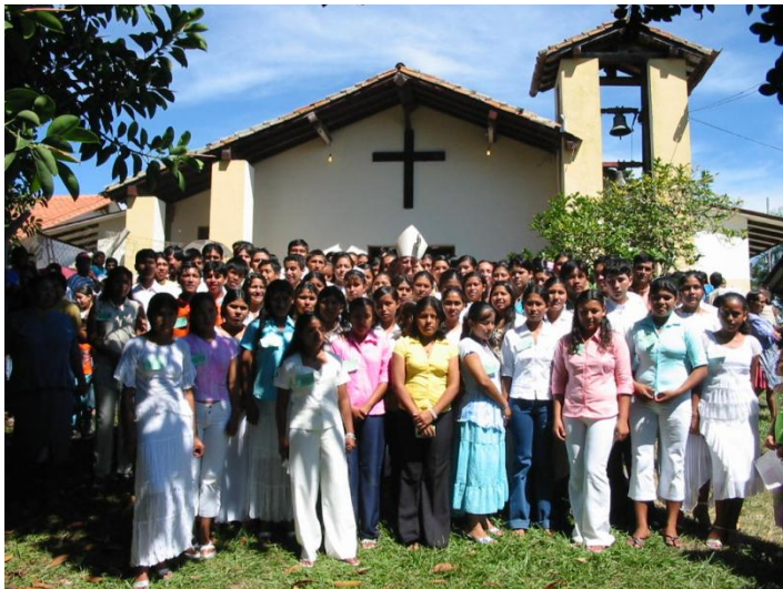
Po bierzmowaniu, przed kościół w San Ramón