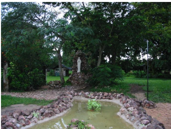
Grota Matki Bożej w San Pablo