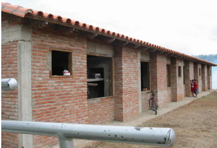
Budowa przedszkola w San Ramón