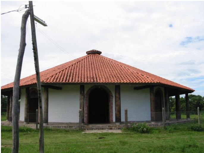
Kościół w Salvatierra