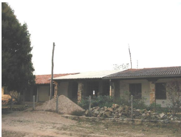
Rozbudowa szpitala w San Antonio