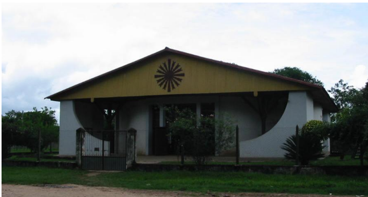
Kościół w San Pablo