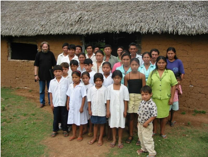
W wiosce Florida