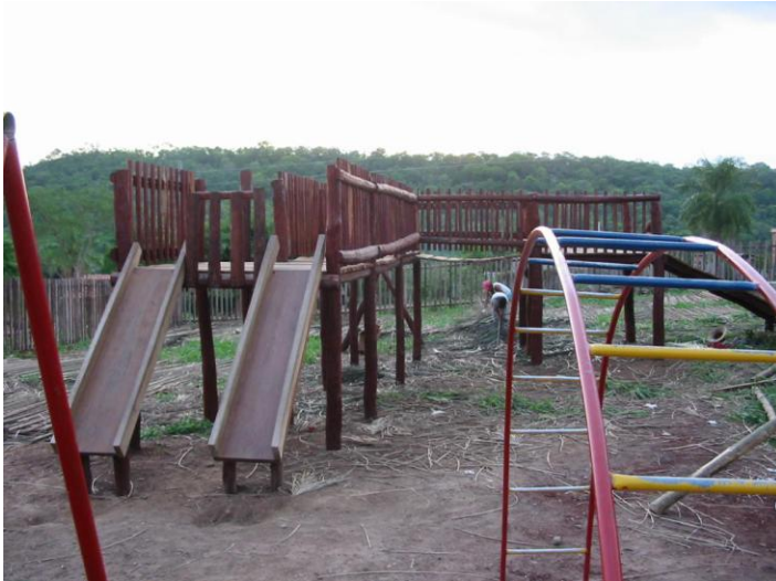
Plac zabaw w przedszkolu w San Ramón