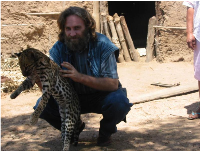
Z młodym „kotkiem”