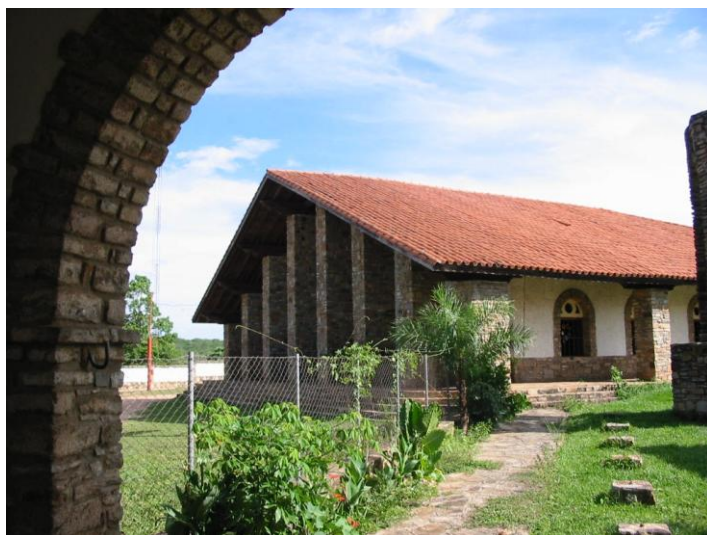
Kościół w San Antonio de Lomerio